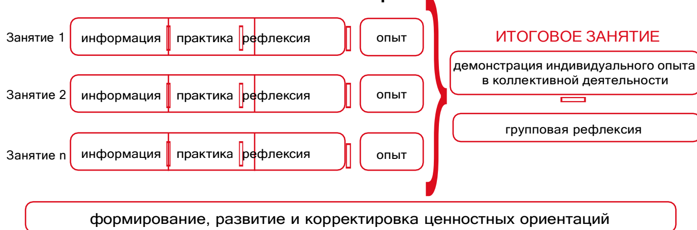
Рисунок 1 — Схема организации события

Таким образом, у пятиклассников происходит построение логической цепочки от собственного опыта проживания каждого занятия к ознакомлению с опытом других детей и к формированию общего отношения классного коллектива к прожитому ими событию.